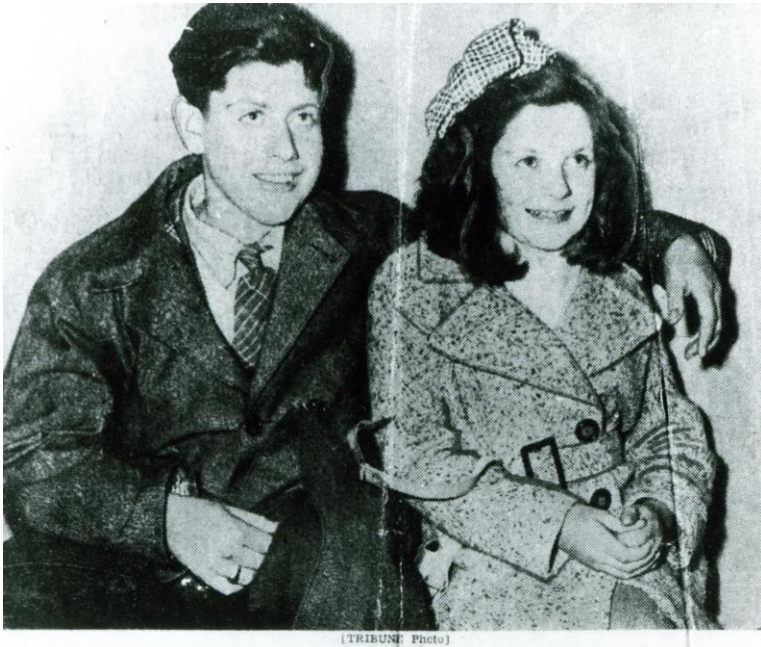
In 1947 Amerika