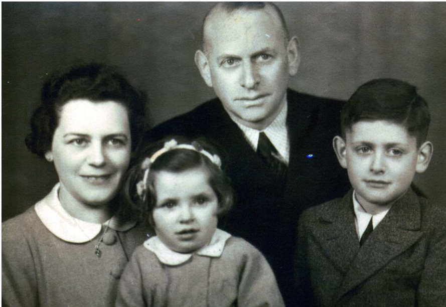
Met vader en moeder